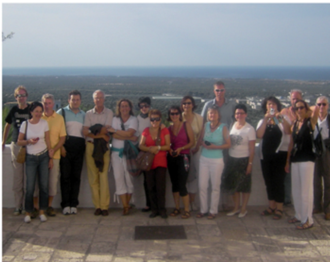
Ostuni, Juni 2009 (unsere Gruppe)

Preise im DZ mit HP und Ausflugsprogramm: 690 Euro p.P. für Anmeldungen bis 28.04.2020: 730 Euro p.P. für spätere Anmeldungen Einzelzimmer-Zuschlag im DZ: 22 Euro/Tag Anzahlung per Überweisung: 25% Eine Verlängerung des Aufenthalts ist möglich.