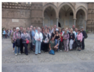
Unsere Gruppe 2013