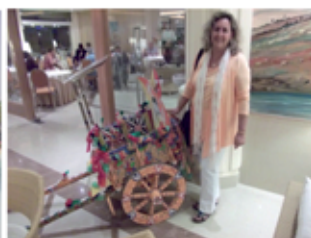
In unserem Hotel