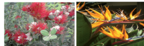
Garten im Hotel