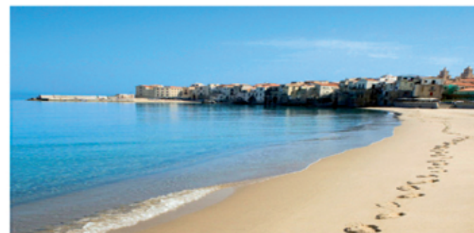
Strand von Cefalù

REISE NACH SIZILIEN MIT SCHNUPPERKURS ITALIENISCH: INSEL VON FEUER, WASSER UND STEINEN Termin: 17.05. bis 24.05.2020