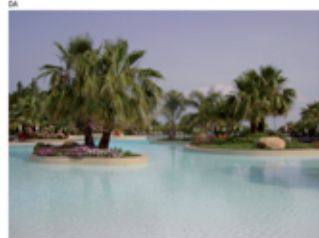
Pool im Hotel

Eine Verlängerung des Aufenthalts ist möglich.