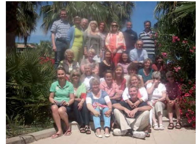
Unsere Gruppe 2013