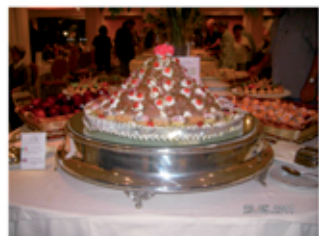
Am Abend Im Hotel