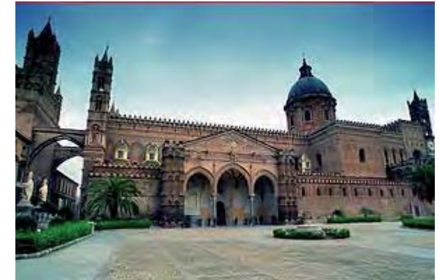
Kathedrale von Palermo

Der Jeep führt Sie bis auf eine Höhe von 3000 m weiter hinauf. Mittagspause. Am Nachmittag fahren wir weiter und besuchen das berühmte Touristenzentrum Taormina mit seinem Theater und dem wundervollen Panorama.